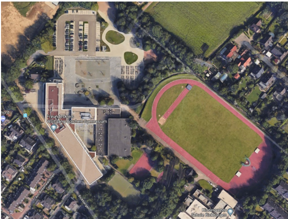
Abbildung 1 - Quelle: maps.google.de

Auf dem Parkplatz des Wolfgang-Borchert-Gymnasiums.